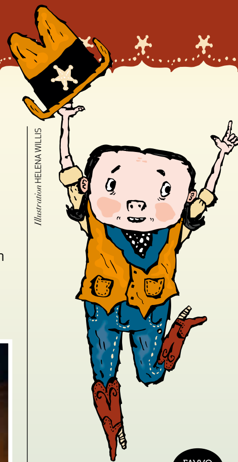
Illustration HELENA WILLIS