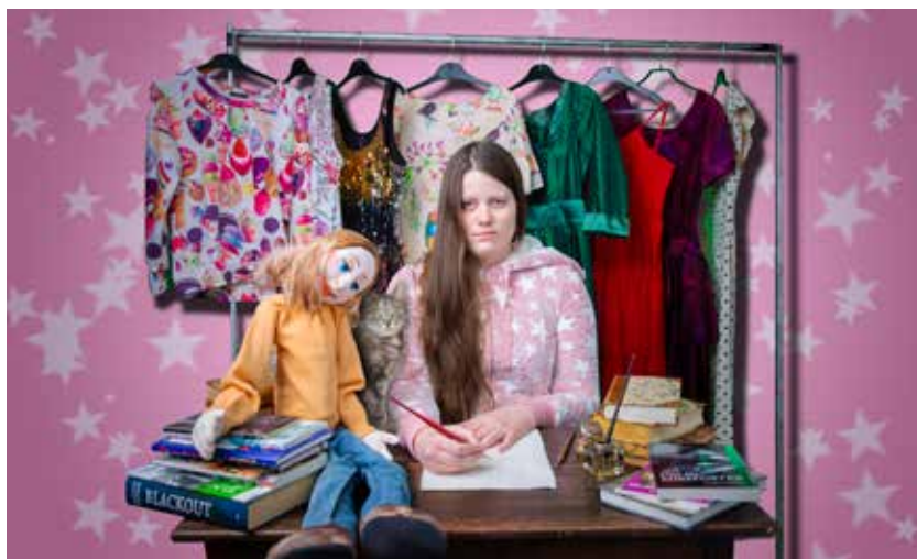
Jul hos Polly 1 – 7 dec

PS Håll utkik på webben gällande Spelman på taket på nyårsafton DS