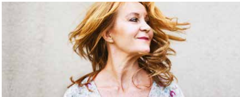
Om att våga flyga 8 nov

Tis 29 okt 12.00 Musik LUNCHKONSERT: DET KVINNliga SPELRUMMET Konsertsalen